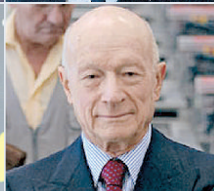
DINASTIE Dall'alto in senso orario: Leonardo Del Vecchio, Giorgio Armani, Bernardo Caprotti e John Elkann